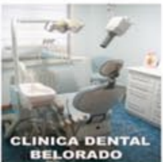
CLINICA DENTAL BELORADO

C/ CANTENEVERVOSA, 4 BAJO BELORADO TELEFONO 947 58 06 72